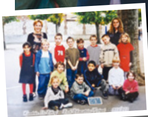
École Sévigné 2001-2002